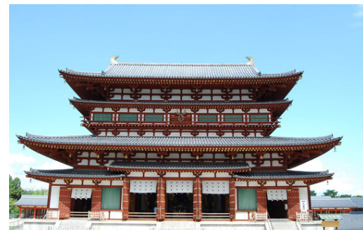
薬師寺（最寄り駅：西ノ京駅）

奈良県ビジターズビューロー （奈良県公式観光サイト）なら旅ネット https://yamatoji.nara-kankou.or.jp/